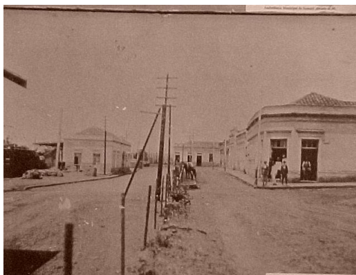
Imagem 2: Av. Júlia de Vasconcellos Bufarah

O município emancipou-se de Campinas em 1953 e a partir dessa década sua população cresceu rapidamente, chegando a aumentar quase 400% nos anos setenta. O vertiginoso crescimento populacional se deveu à rápida industrialização e à consequente vinda de migrantes de todo o país.